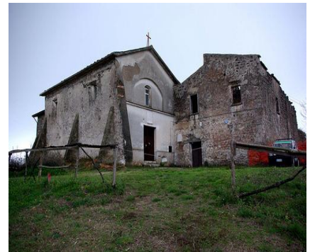
Santuario di Monte Lucno

risulta dalla cartina IGM), superato un ponte, si lascia il sentiero a sinistra che conduce a Garofali (itinerario, percorso nel 2010 con la guida del socio Vittorio, roccano e appassionato torrentista del Savone) per proseguire nella stessa direzione. Superato un quadrivio (567 m), ad una successiva biforcazione, si prosegue sul ramo di destra fino a raggiungere la strada asfaltata tra Ovalli e Tavola; attraversatala, si prosegue fino ad un'altra strada asfaltata: Roccamonfina - Marzano; da qui si piega a sinistra verso il